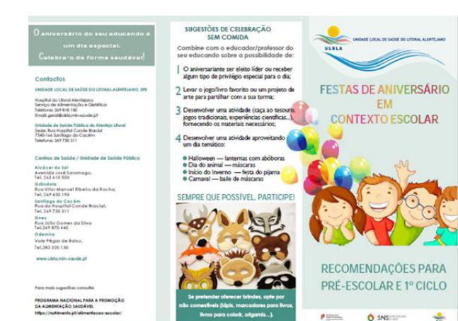
Figura 6 – Prospeto Festas de Aniversário em contexto escolar