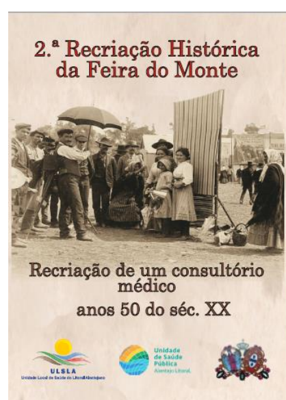
Figura 8 – Catálogo Recriação Histórica Feira do Monte 2019