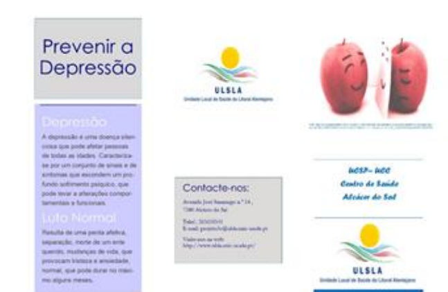
Figura 7 – Prospeto Prevenir a Depressão