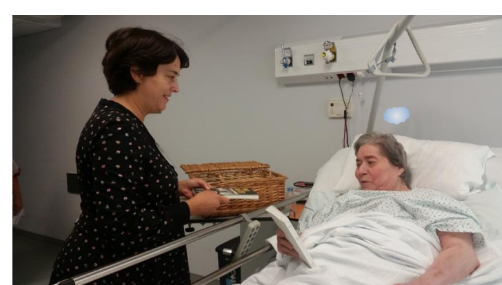
Figura 3 – Empréstimo ao Doente Internado