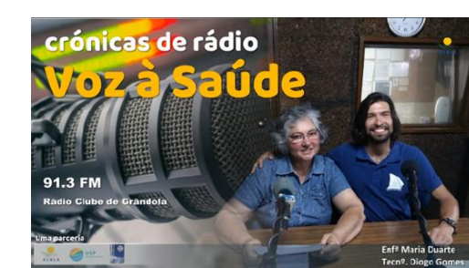
Figura 5 – Emissão de rádio com informação de saúde