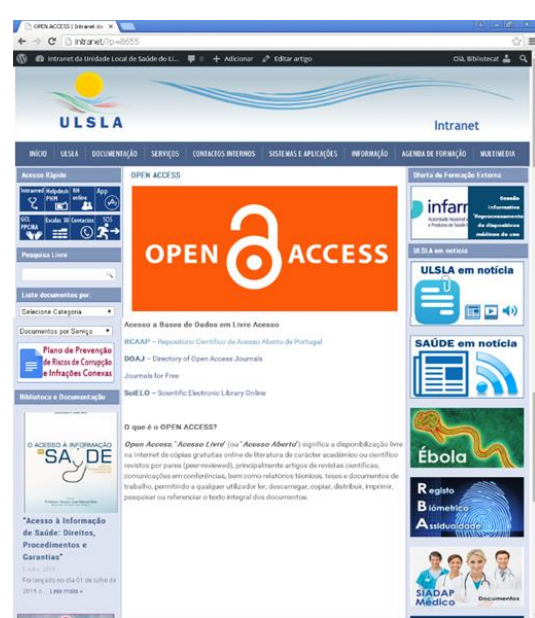
Figura 1 – Biblioteca Digital ULSLA