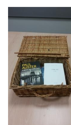
Figura 4 – Empréstimo ao Doente Internado